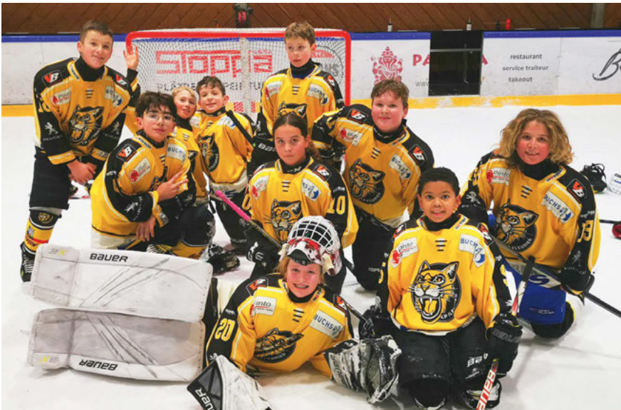
U12-2: 1 victoire et 4 défaites au tournoi de Neuchâtel. Contre HCC II 5-4, contre Yverdon 2-5, contre Neuchâtel I 1-4, contre HCC I 2-3 et 1-3 contre Neuchâtel II.