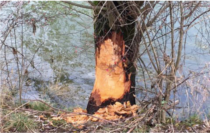
Au bord de l'Areuse, à Môtiers, un nouvel ingénieur en eaux et forêts hors pair s'y est installé !