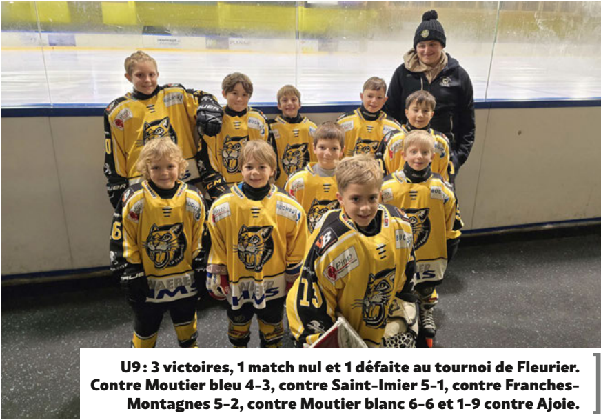
U9: 3 victoires, 1 match nul et 1 défaite au tournoi de Fleurier. Contre Moutier bleu 4-3, contre Saint-Imier 5-1, contre Franches-Montagnes 5-2, contre Moutier blanc 6-6 et 1-9 contre Ajoie.