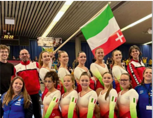
Au premier plan, l'équipe C5 neuchâteloise et debout au second plan l'équipe Dames neuchâteloise, les juges et coaches pour Neuchâtel