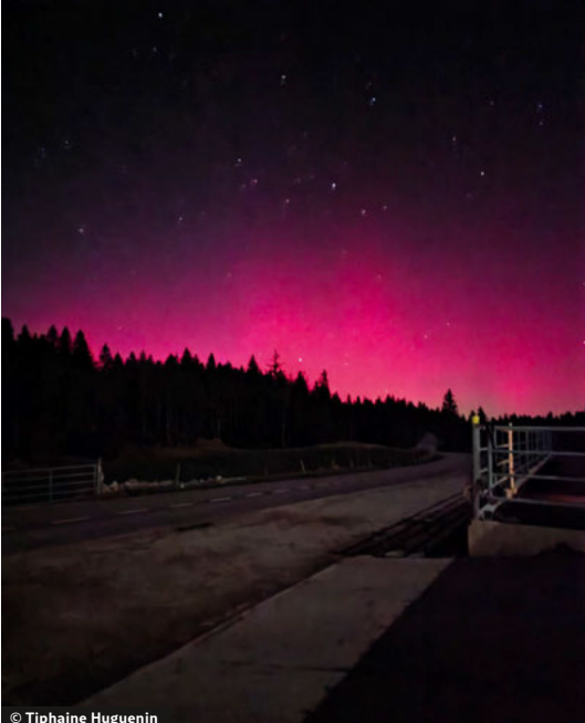
Il ne fallait pas aller se coucher la nuit du mardi 11 au mercredi 12 novembre dernier si vous vouliez voir ce magnifique spectacle...

Le Conseil d’État a adopté le nouvel arrêté concernant l’exercice de la pêche valable pour la saison 2026, qui fixe les principes et règles halieutiques à respecter dans les eaux neuchâteloises, à l’exclusion du lac de Neuchâtel.