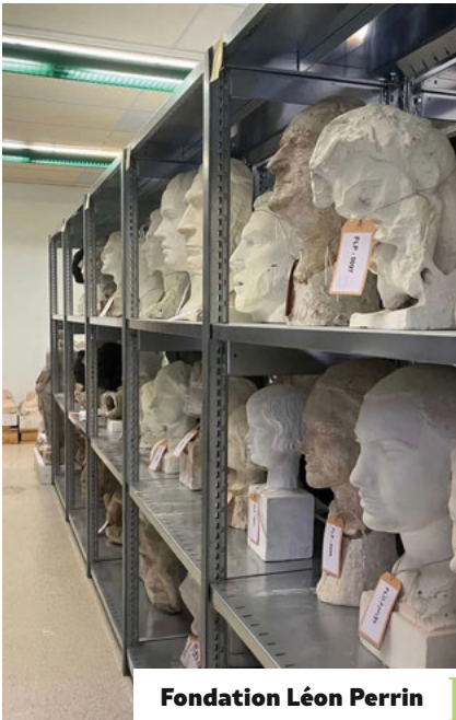
Fondation Léon Perrin