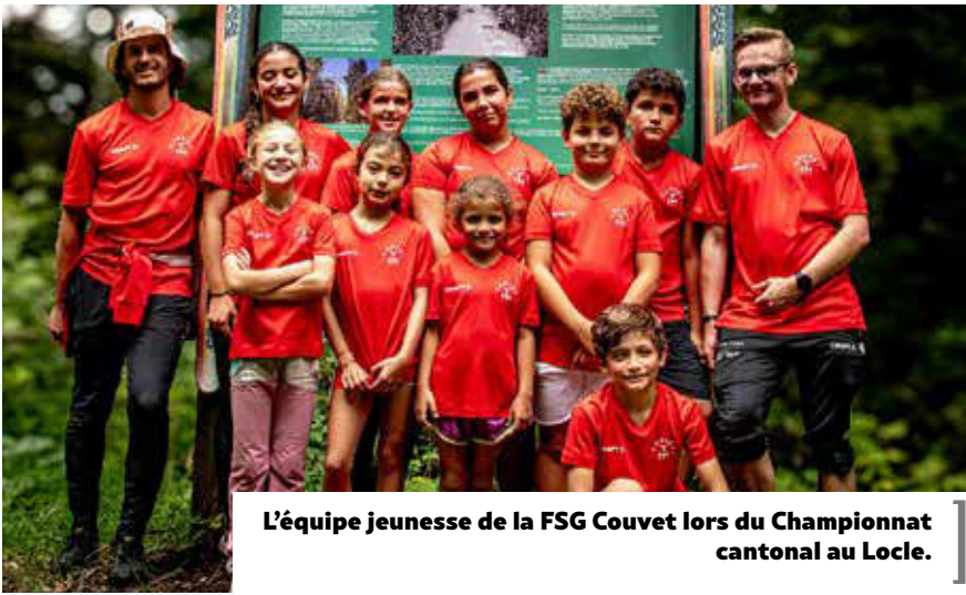
L’équipe jeunesse de la FSG Couvet lors du Championnat cantonal au Locle.

Deux compétitions qui confirment le dynamisme et l’engagement de la FSG Couvet, tant chez les jeunes débutants que chez les athlètes plus expérimentés.