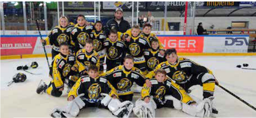
U12-2: 3 matches gagnés et 2 matches perdus au tournoi de La Chaux-de-Fonds. Contre White 4-1, contre Blue 4-2, contre Uni 7-3, contre Berne 3-7 et 2-6 contre Yverdon