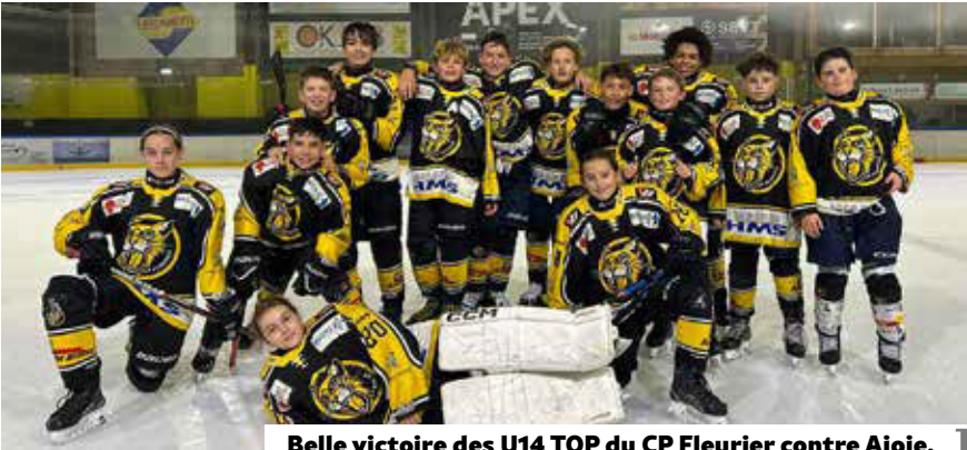
Belle victoire des U14 TOP du CP Fleurier contre Ajoie. Score final 7-5

Le Locle – Val-de-Travers 6-1 (3-0) But de: Teixeira.