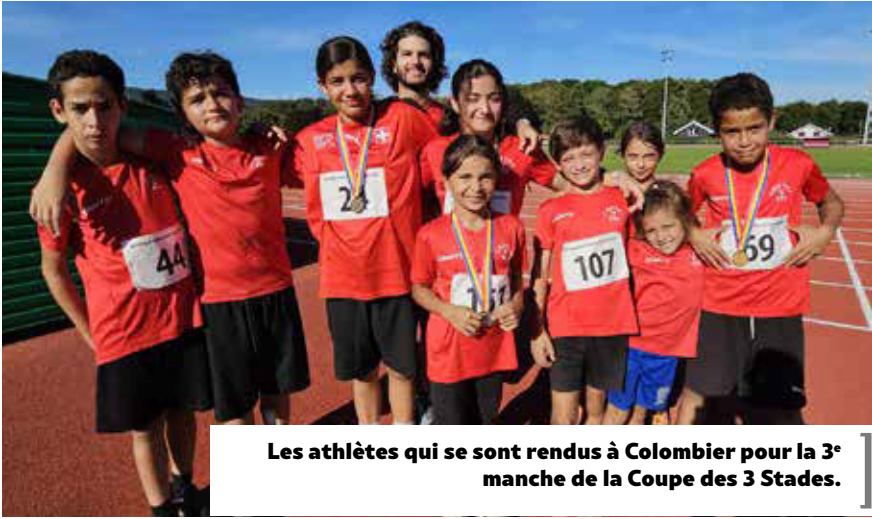
Les athlètes qui se sont rendus à Colombier pour la 3 e manche de la Coupe des 3 Stades.

Le 7 septembre dernier, la FSG Couvet s’est rendue à Colombier pour la 3 e manche de la Coupe des 3 Stades avec une délégation de 13 athlètes. Une belle moisson de résultats est venue récompenser leurs efforts: 4 athlètes sont montés sur le podium, tandis que 3 autres ont terminé au pied du podium, décrochant une «médaille en chocolat». Deux autres membres de l’équipe se sont classés à la 5 e place dans leurs disciplines respectives.