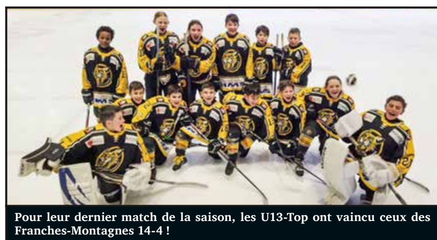
Pour leur dernier match de la saison, les U13-Top ont vaincu ceux des Franches-Montagnes 14-4 !