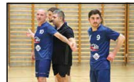
« Les bleus » du HC Val-de-Travers ont gagné sur le terrain et des places au classement.