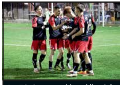
Le FC Couvet a bien débuté le tour de printemps ce week-end.