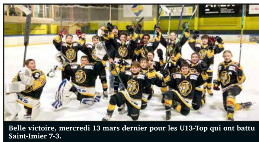
Belle victoire, mercredi 13 mars dernier pour les U13-Top qui ont battu Saint-Imier 7-3.