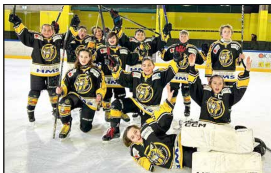
Tournoi à Fleurier, samedi, pour les U13-A du CP Fleurier. Une victoire contre le HC Moutier 6-2, un match nul contre Uni NE 3-3 et une défaite contre HCC Academy 1-6.