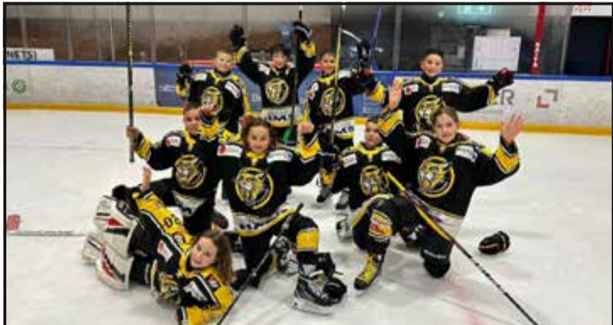
U11-1 : 1 match gagné, 1 match nul et 1 match perdu au tournoi de Neuchâtel. Contre La Chaux-de-Fonds 9-7, contre Neuchâtel 6-6 et 3-15 contre Yverdon.