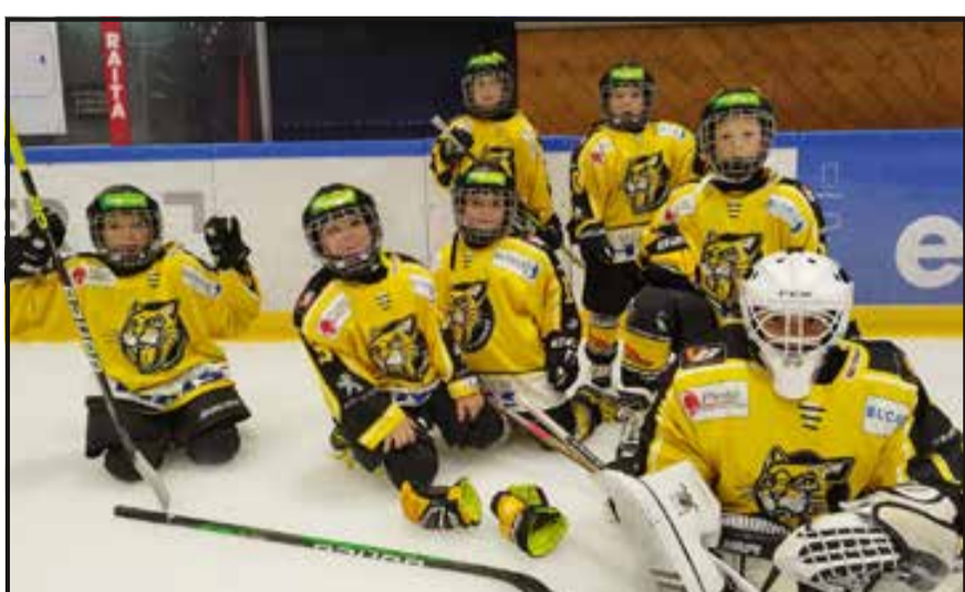
U9-1 : 2 matches gagnés et 1 match perdu au tournoi de Neuchâtel. Contre Université Neuchâtel 6-4, contre Delémont Vallée 10-2 et 3-5 contre La Chaux-de-Fonds.