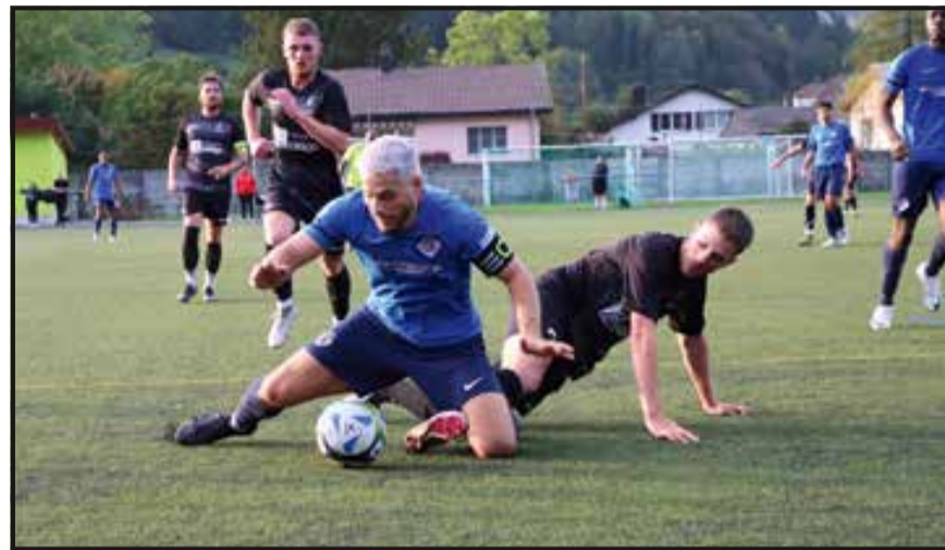
Les Fleurisans ont cru qu'ils avaient réussi à mettre à terre le leader loclois après 45 minutes. Mais le film du match s'est inversé en 2 e période.

Grâce à la fonction « replay », avançons immédiatement les images jusqu'à la fin du film. Nous jouons la 93 e minute aux Sugits. Les Fleurisans ont souffert toute la deuxième période face au leader loclois qui s'est finalement rebiffé. Il y a désormais 2-2 dans ce match et les héros locaux tentent de préserver le point du match nul. Mais les bleus déferlent une nouvelle fois dans la surface vallonnière. La défense cafouille, la balle rebondit à gauche, à droite,