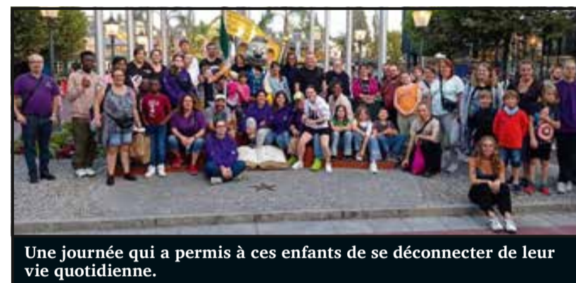
Une journée qui a permis à ces enfants de se déconnecter de leur vie quotidienne.

Samedi dernier, Un P'tit Plus avait donné rendez-vous, de bonne heure le matin, à des bénévoles de l'association, des invités et des familles d'enfants malades pour une journée de détente.