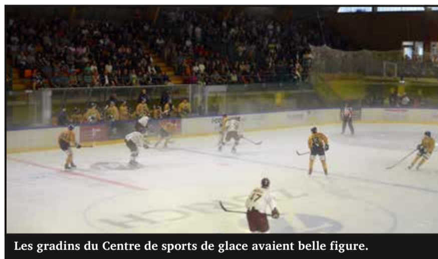
Les gradins du Centre de sports de glace avaient belle figure.