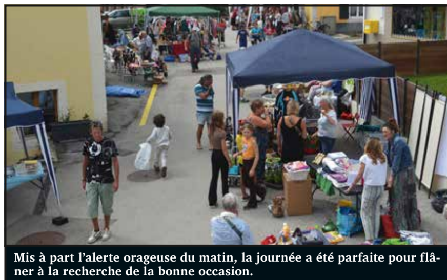
Mis à part l'alerte orageuse du matin, la journée a été parfaite pour flâner à la recherche de la bonne occasion.

Samedi matin, un orage court mais « punchy » s'est abattu sur le Val-de-Travers. Ce n'était pas matinée à mettre un chien dehors. Et pourtant, 47 stands avaient décidé de « vider leurs greniers » dans les rues de La Côte-aux-Fées à l'occasion de « Broc Ô Fées ». Les plus chanceux étaient abrités par des tentes pendant que d'autres se sont employés à manier le système D pour mettre en sécurité leurs stocks. C'est dans cette atmosphère « post alerte orageuse » que je suis arrivé sur place. Ambiance !