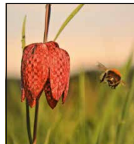
L'une des photos exposées par Thierry Ray. La fritillaire pintade est une fleur protégée. Sur cette image, le bourdon semble se charger de sa sécurité.

L'artiste termine de valoriser sa réalisation en la faisant épouser un support, idéal pour placer l'œuvre devant une source lumineuse. « Jouer avec la transparence et les couleurs de lumière est la toute dernière étape du processus. » Au final, c'est aux acheteurs qu'il convient de choisir quels reflets ils veulent mettre dans leur vie.