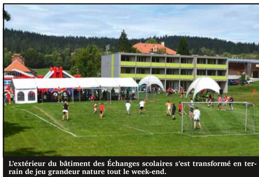
L'extérieur du bâtiment des Échanges scolaires s'est transformé en terrain de jeu grandeur nature tout le week-end.

Vous ne devinez jamais quelle a été l'unique exigence du groupe de Montpellier. Essayez quand même de trouver ! Trois, deux, un : il a demandé aux organisateurs de lui fournir un... bateau pneumatique ! Vous voyez que c'était vrai ! En effet, le péché mignon du chanteur est de fendre la foule sur un bateau pneumatique à un moment du concert. Porté par les spectateurs, il est alors conduit jusqu'au bar où il se tire une bière. Et puis il revient poursuivre son show. C'est la première fois que les Comrades vogaient sur les « eaux suisses ». Une première qui en appellera vraisemblablement d'autres tant il sait mettre le feu. Dimanche, la quiétude du village a une nouvelle fois été brisée.