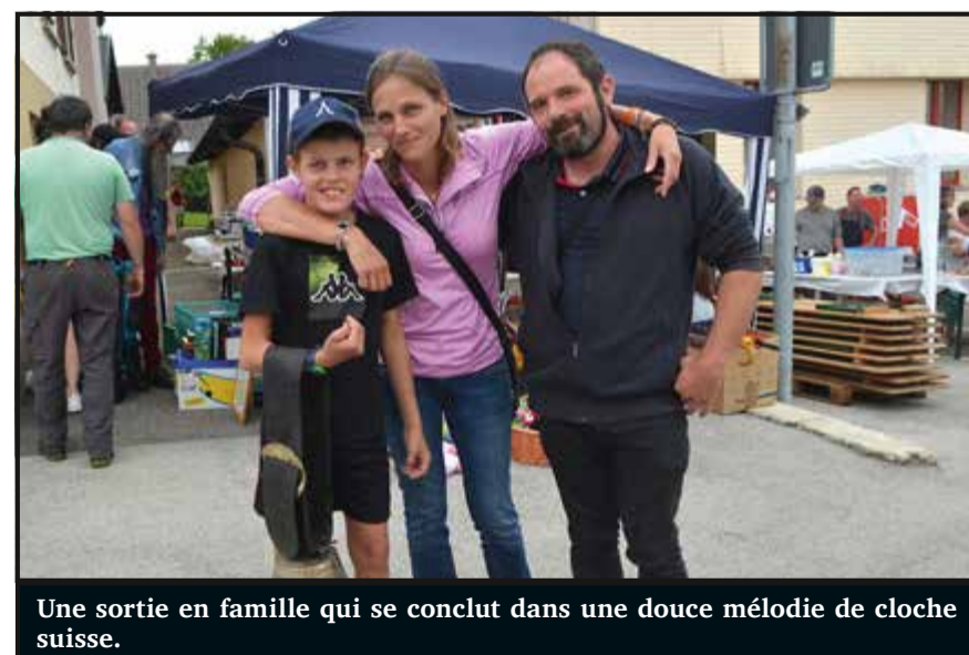
Une sortie en famille qui se conclut dans une douce mélodie de cloche suisse.

Finalement, tout s'est bien déroulé par la suite, comme lors du 1 er août du village (aussi organisé par les 5 copines). Vers la grande buvette du centre du village, mon tour se termine auprès d'un binôme fleurisan. Sans conteste le plus à l'aise avec la pluie puisqu'il vendait... des vases. Mais au final, ce sont bien les organisatrices qui ont reçu des roses pour leur organisation bien huilée.