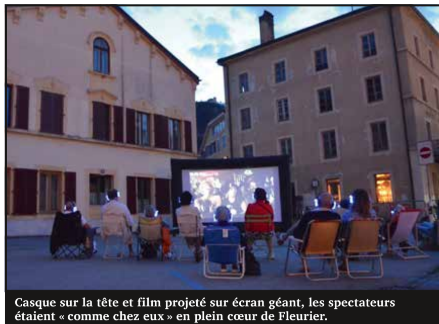
Casque sur la tête et film projeté sur écran géant, les spectateurs étaient « comme chez eux » en plein cœur de Fleurier.

Pour l'heure, la soirée la plus suivie a attiré 70 spectateurs sur la place du Marché de Fleurier. Et comme le film se savoure avec un casque audio sur la tête, pas de