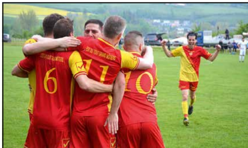
Le FC Môtiers se veut prudent au moment d'aborder la saison 2023/24. Que valent les « flingueurs » en 3 e ligue ? Ils vont nous le montrer dès ce week-end face au voisin Couvet (samedi 18 h 30, terrain de La Léchère).