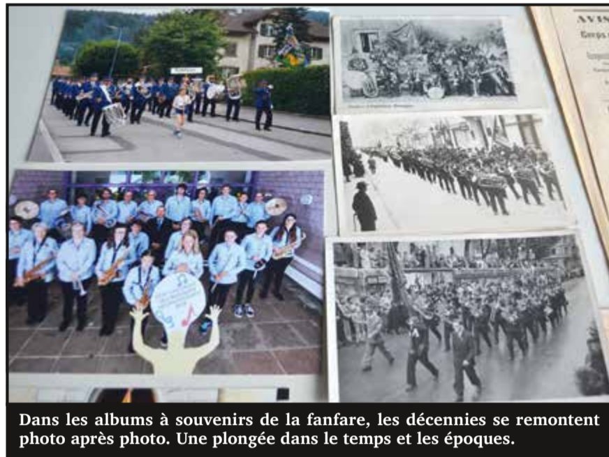
Dans les albums à souvenirs de la fanfare, les décennies se remontent photo après photo. Une plongée dans le temps et les époques.

C'est un jour de 1873 que la fanfare l'Espérance de Noiraigue a envoyé ses premiers échos dans la vallée. Année après année, cette société a tenu un rôle de pilier dans de nombreuses familles. Chacun, ou presque, avait un proche qui en faisait partie. L'intégrer, c'était respecter un rite et s'inscrire dans la lignée familiale. C'était aussi une façon de rapprocher les habitants et de les unifier. 150 ans après sa création, la fanfare est toujours active au village et ils sont une vingtaine à faire persister son écho dans la même vallée. Flashback !