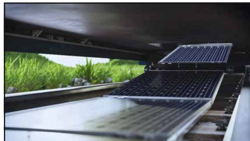
Sun-Ways a développé une machine capable d'installer 1 kilomètre de panneaux solaires, entre les rails, en 90 minutes à peine. Il ne s'agit pour l'heure que d'un prototype. La version finale devrait être encore plus rapide.

Joseph Scuderi et son équipe doivent donc apporter eux-mêmes