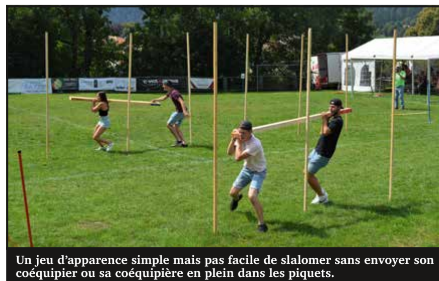
Un jeu d'apparence simple mais pas facile de slalomer sans envoyer son coéquipier ou sa coéquipière en plein dans les piquets.