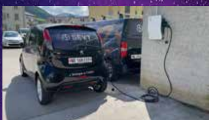
Bornes de recharge