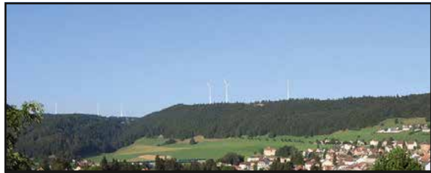
D'après la projection de Romande Énergie, voilà à quoi ressemblera le site de Sainte-Croix, une fois que les six éoliennes auront été installées.

Alors qu'une partie de la population valloisienne est vent debout contre l'installation d'éoliennes sur son territoire, le premier « parc à hélices » vaudois est en train de prendre forme à quelques kilomètres. C'est à Sainte-Croix que six pales sont actuellement assemblées après des années de bataille. Les habitants ont pu voter – de façon consultative – en 2012 et une légère majorité s'était alors dessinée en faveur du parc à hélices (1103 voix pour et 966 contre). Venues d'Allemagne, les pièces ont transité par la route du Val-de-Travers. Et si le prochain convoi s'arrêtait « chez nous » ?