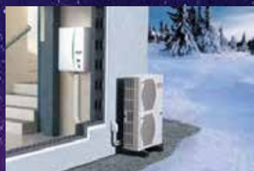
Pompe à chaleur