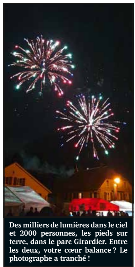
Des milliers de lumières dans le ciel et 2000 personnes, les pieds sur terre, dans le parc Girardier. Entre les deux, votre cœur balance ? Le photographe a tranché !

Bien entendu, il a fallu trouver un accord avec l'agriculteur pour utili-