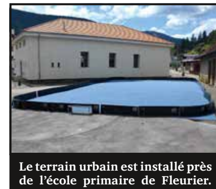
Le terrain urbain est installé près de l'école primaire de Fleurier.