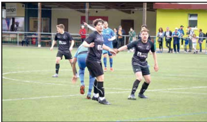
Il est bientôt temps de désactiver le mode « pause » et de reprendre du service sur les terrains valloisiers. Les championnats reprennent le week-end du 18 au 20 août. Le FC Fleurier se dit prêt.