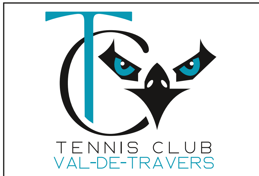
Le nouveau logo du club de tennis se veut sobre et épuré. Le TC Val-de-Travers a choisi le milan pour porter ses espoirs de futur serein.