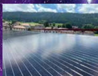
Installation photovoltaïque Communauté d'autoconsommation