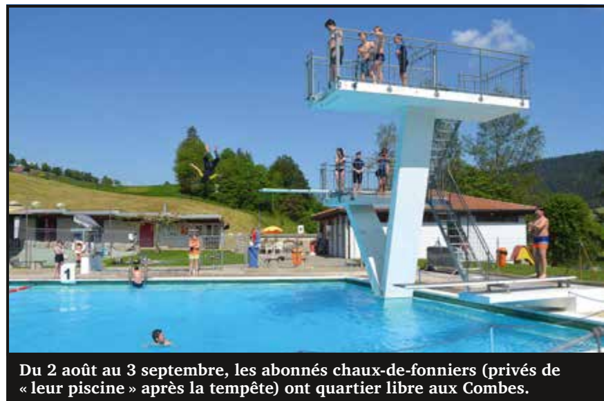
Du 2 août au 3 septembre, les abonnés chaux-de-fonniers (privés de « leur piscine » après la tempête) ont quartier libre aux Combes.