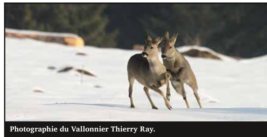
Photographie du Vallonnier Thierry Ray.

Bleu de Chine propose une exposition haute en couleur pour accompagner la rentrée des vacances de cet été 2023.