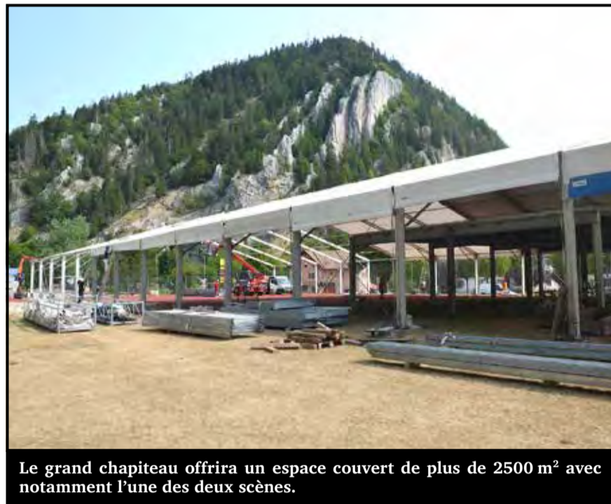
Le grand chapiteau offrira un espace couvert de plus de 2500 m 2 avec notamment l'une des deux scènes.

Après 21 mois de « gestation », le nouveau-né des festivals romands, Trouble A, voit le jour ce 6 juillet 2023. Une programmation 100% helvétique se produira durant trois jours en open air (scène l'Heure bleue) et sous un grand chapiteau de 2560 m 2 (Artemisia). Ce même chapiteau abritera aussi le Comptoir du Val-de-Travers du 1 er au 10 septembre prochain. Le plus gros défi (à priori réussi) de Trouble A est d'avoir su composer avec un budget de 500'000 francs.