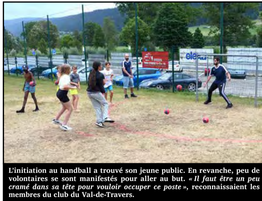
L'initiation au handball a trouvé son jeune public. En revanche, peu de volontaires se sont manifestés pour aller au but. « Il faut être un peu cramé dans sa tête pour vouloir occuper ce poste », reconnaissent les membres du club du Val-de-Travers.

Le club de handball du Val-de-Travers a attiré de nombreux jeunes lors de son initiation donnée par des joueurs valloisiers. « Nous sommes une équipe qui joue pour le plaisir. Mais nous aimerions nous développer avec la création d'une formation de juniors. On est donc très contents de voir que notre venue intéresse autant de jeunes. » Par ailleurs, le club va probablement inscrire une équipe adulte en championnat l'an prochain. Il reste cependant quelques détails à régler pour trouver une salle aux dimensions adaptées. Celle d'espaceVal étant malheureusement un peu trop petite pour recevoir des matches officiels. On a envie de leur dire une chose : jetez-vous à l'eau !