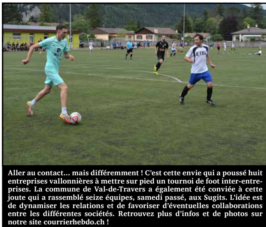
Aller au contact... mais différemment ! C'est cette envie qui a poussé huit entreprises vallonnières à mettre sur pied un tournoi de foot inter-entreprises. La commune de Val-de-Travers a également été conviée à cette joute qui a rassemblé seize équipes, samedi passé, aux Sugits. L'idée est de dynamiser les relations et de favoriser d'éventuelles collaborations entre les différentes sociétés. Retrouvez plus d'infos et de photos sur notre site courrierhebdo.ch !