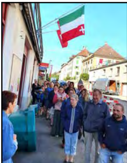
Malgré la capacité d'accueil augmentée dans le hangar de Rothel, certaines personnes sont reparties les mains vides. La venue d'Oesch's die Dritten suscite un gros engouement.

Audrey Somogyi. Dans le détail, 122 tickets sont réservés pour les sponsors et 288 sésames ont été vendus le 1 er juillet (144 à Travers et 144 aux Ponts). Si cette étape a été un énorme succès, c'est un autre défi qui s'avance désormais pour les organisateurs. « Il s'agira de réussir à contenter tout le monde au niveau de la restauration durant le soir du spectacle. » Ça ne va pas être de la tarte mais ils en ont vu d'autres, n'est-ce pas ?