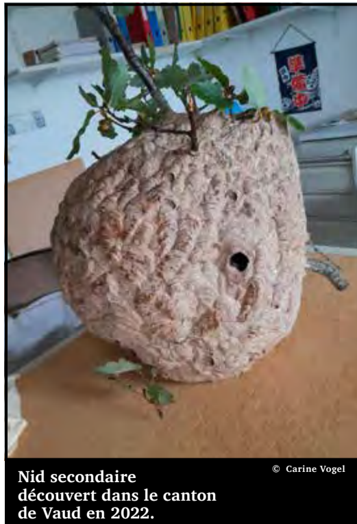
Nid secondaire découvert dans le canton de Vaud en 2022.