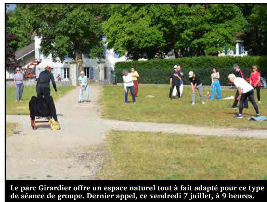
Le parc Girardier offre un espace naturel tout à fait adapté pour ce type de séance de groupe. Dernier appel, ce vendredi 7 juillet, à 9 heures.

Il n'empêche que la Fleurisane est venue à vélo jusqu'à Môtiers ce jour-là. Je lui fais donc remarquer qu'elle reste encore passablement active. « C'est vrai. Je cultive régulièrement mon jardin pour être autonome. Je mange ce que je produis et ça fait bouger. » Et ne lui parlez pas de supermarché : « Quel horreur ! Avec tous ces