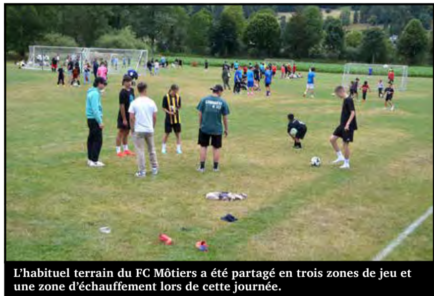
L'habituel terrain du FC Môtiers a été partagé en trois zones de jeu et une zone d'échauffement lors de cette journée.