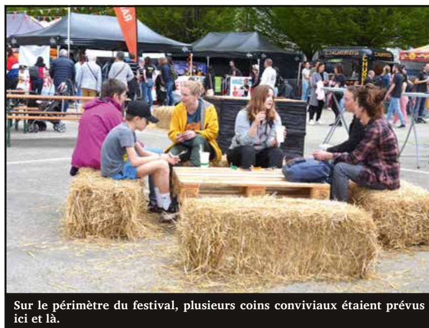
Sur le périmètre du festival, plusieurs coins conviviaux étaient prévus ici et là.

À l'inverse, comme la scène se trouvait sous la tente cette année,