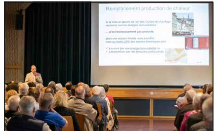
La séance de présentation et d'information publique concernant le projet de chauffage à distance, organisée par le Groupe E et la Commune de Val-de-Travers, a attiré un nombreux public, jeudi 4 mai, avec une salle Fleurisia archi-comble.