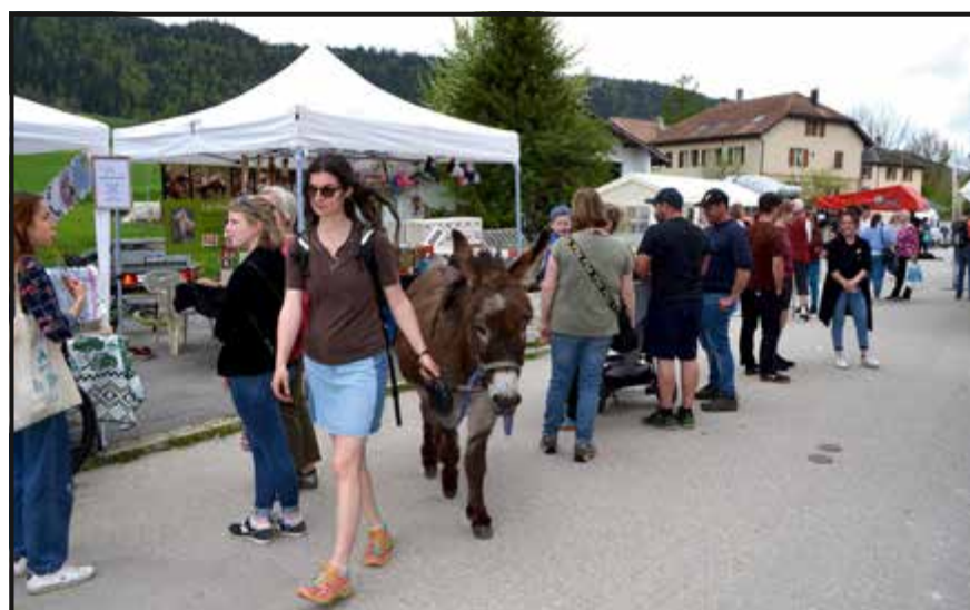
Du monde tout le long de la rue du Pont de Travers. Une image qui fait plaisir à voir. Les habitants tiennent à leur « nouveau » marché.