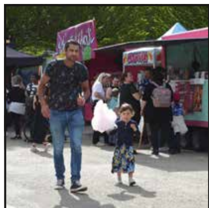
Food trucks pour petits et grands se sont arrêtés sur la place de Longereuse de Fleurier.

Un petit festival sur la place de Longereuse ? Non, l'AR Mood Festival est bien plus que ça. Il y a un vrai « mood », un vrai esprit, une vraie atmosphère autour de cet événement créé et porté par un comité de onze Vallonniers. Des idées d'ici qui plaisent aux gens d'ici. Il ne faut pas chercher plus loin pourquoi on s'y sent bien à ce festival. Chacun y trouve sa place et son compte. L'entrée gratuite donne un côté populaire qu'on ne trouve pas nécessairement ailleurs.