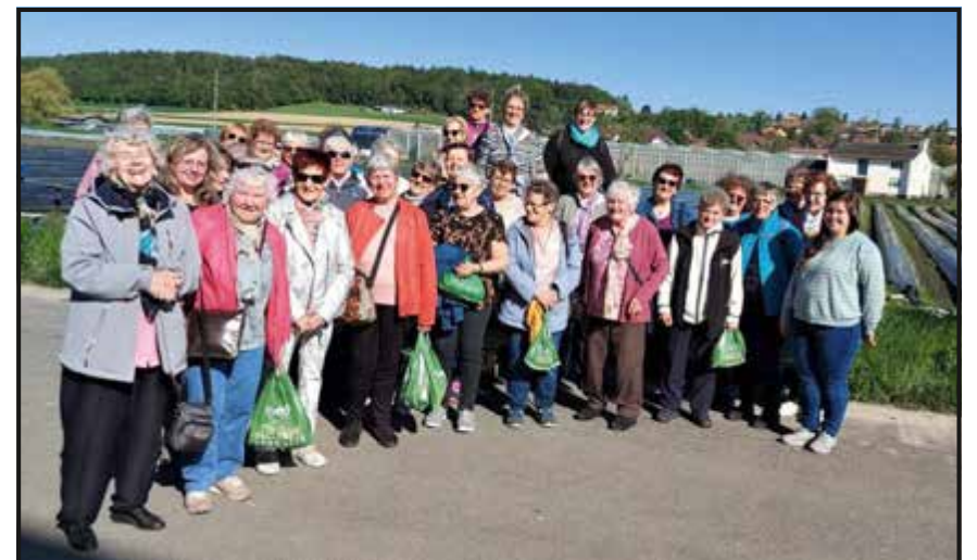
Une partie des femmes paysannes du Val-de-Travers ont participé à leur course de printemps le 3 mai dernier. Elles ont débuté leur périple en train touristique dans la ville de Morat avant de s'envoyer un bon repas dans un restaurant de la place. Les participantes ont ensuite visité une culture d'asperges dans le Seeland où leur conditionnement leur a notamment été expliqué. La journée s'est ponctuée sur une bonne tranche de gâteau du Vully avant le retour, et la digestion, en car.