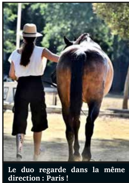
Le duo regarde dans la même direction : Paris !

pour venir à ce concours, c'était très dur à accepter. Le temps était pourri aussi, il a plu tout le week-end et il faisait froid. Bref, il faut se dire que nous avons commencé par le plus difficile et que ça ne peut qu'aller mieux lors de la prochaine compétition. C'était quand même une bonne expérience et il fallait essayer de concourir dans ce prestigieux concours. Je ne regrette pas mon choix, j'ai appris à gérer tous les éléments perturbateurs qui peuvent venir s'ajouter à l'aspect sportif d'un grand rendez-vous.