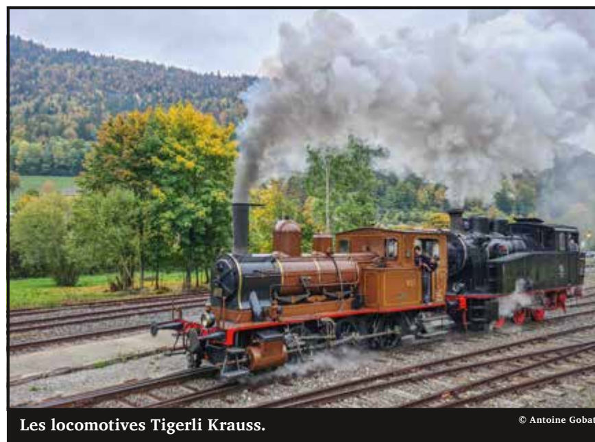
Les locomotives Tigerli Krauss.

« À la fin de la saison 2022, nous avons été heureux de constater une nouvelle fois une augmentation importante des voyageurs à bord de nos trains. Le cap de 6000 visiteurs a été dépassé. » Un chiffre qui encourage les bénévoles et le comité à continuer d'innover et