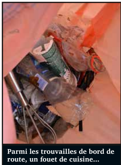
Parmi les trouvailles de bord de route, un fouet de cuisine...

Une poignée de morilles, une chaussure, des médicaments, un fouet et des dizaines et des dizaines de canettes de Red Bull (et autres). Voilà une partie de la cueillette de samedi, sur les bords de la Côte-Rosière. La 2 e édition de l'opération « nettoyage de printemps » du Mouvement citoyen neuchâtelois a permis de retirer une cinquantaine de kilos de déchets, uniquement avec ce qui se trouvait en bordure de route. Alors qu'ils étaient une dizaine en 2022, ils n'étaient que deux à se retrousser les manches cette année. Il faut voir les choses du bon côté, il y aura moins à partager lorsque les morilles trouvées seront dégustées au cours d'un bon repas.