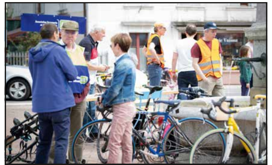
Samedi sur la place du Marché de Fleurier, la bourse aux vélos de l'Association transports et environnement a attiré son lot de vendeurs et d'acheteurs.