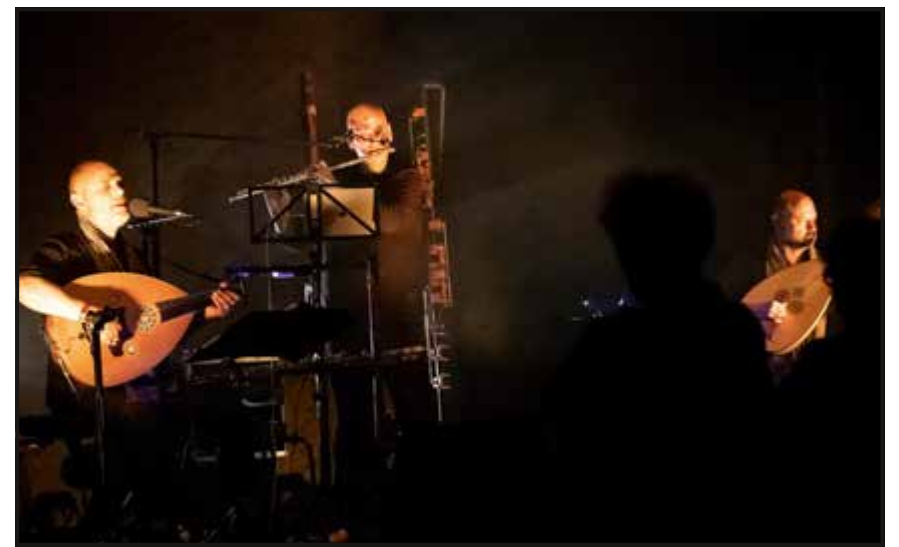
C'est sur les planches du théâtre des Mascarons, à Môtiers, que les trois musiciens de « ZZHR » ont présenté leur création « Resonances III », dimanche, et proposé un voyage musical et poétique.