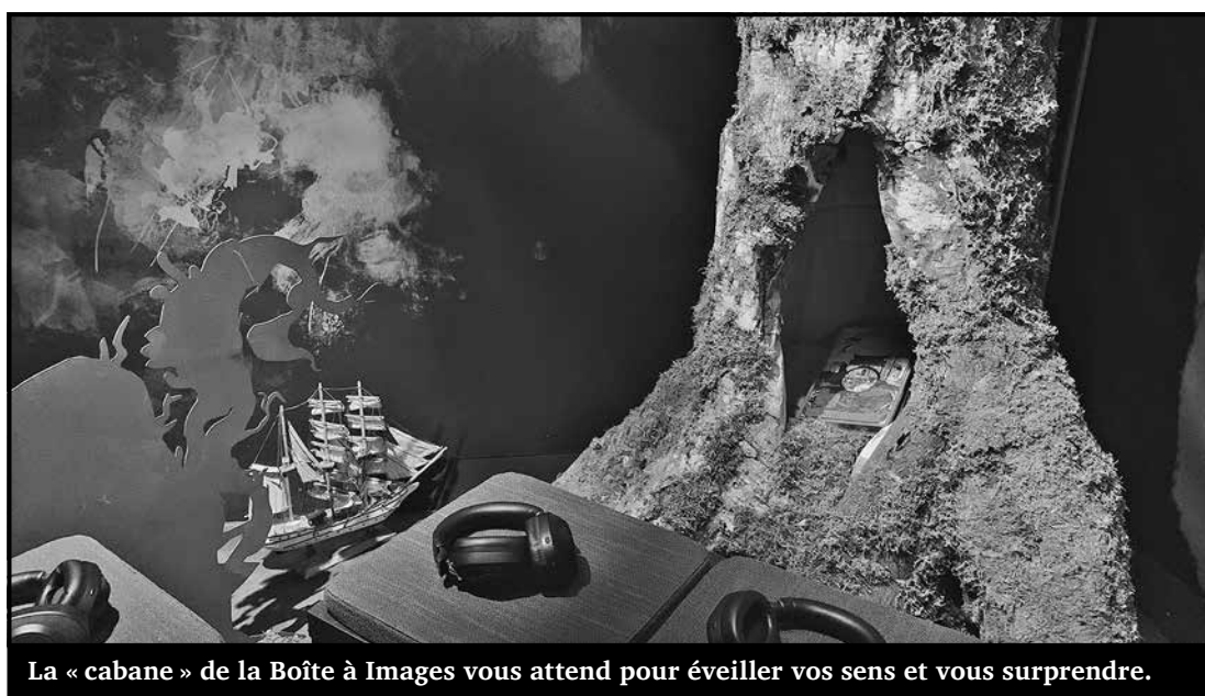
La « cabane » de la Boîte à Images vous attend pour éveiller vos sens et vous surprendre.

Étant actuellement en 3 e année de Bachelor en droit économique à la HEG de Neuchâtel, je recherche un travail dans le domaine de l'administratif afin de compléter mon emploi du temps. Je suis titulaire d'un CFC d'employé de commerce et d'une maturité commerciale. Je suis disponible pour un taux d'activité avoisinant les 30%, à discuter. Pour toutes questions, vous pouvez me joindre par téléphone au 076 595 41 29.