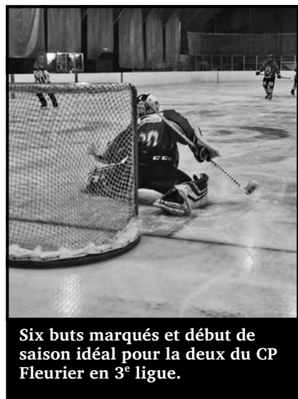
Six buts marqués et début de saison idéal pour la deux du CP Fleurier en 3 e ligue.

Ils sont habiles ces Chats-là ! Les joueurs de la deuxième équipe du CP Fleurier ont remporté vendredi leur premier match de championnat de troisième ligue aux Ponts-de-Martel.