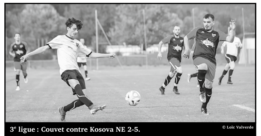
3 e ligue : Couvet contre Kosova NE 2-5.