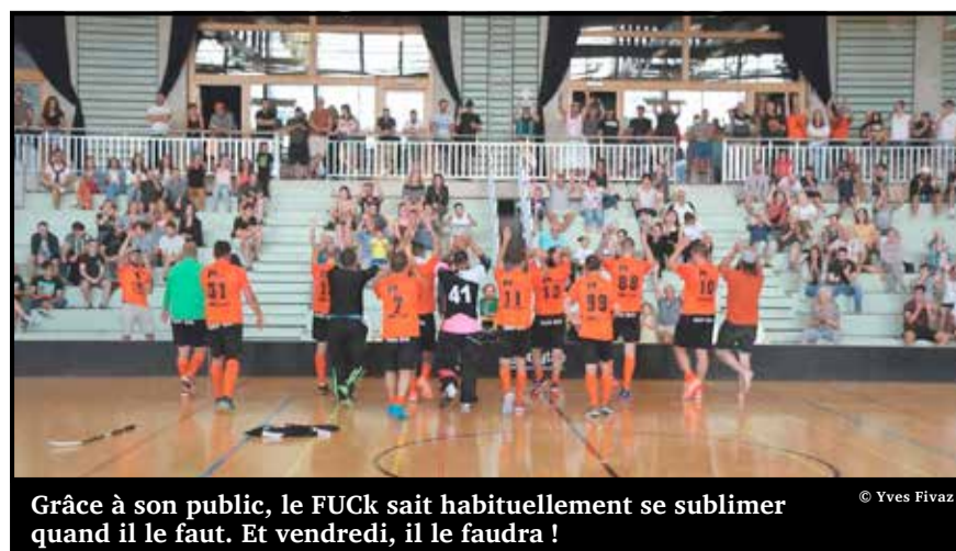
Grâce à son public, le FUCk sait habituellement se sublimer quand il le faut. Et vendredi, il le faudra !

pour y arriver. » Chers Vallonniers, le pass sanitaire sera nécessaire pour assister à cette confrontation. Mais une fois à l'intérieur, une cantine vous permettra de vous restaurer comme bon vous semble !