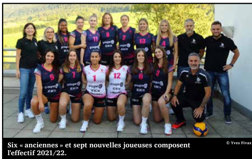
Six « anciennes » et sept nouvelles joueuses composent l'effectif 2021/22.

Pour être un témoin privilégié de cette progression au fil des mois, vous pouvez vous procurer l'abonnement de saison au Kiosque de Couvet et à l'institut Fanya de Fleurier. Il sera aussi vendu directement sur place à espaceVal et il est actuellement déjà disponible sur le site internet du club.