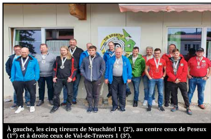
À gauche, les cinq tireurs de Neuchâtel 1 (2 e ), au centre ceux de Peseux (1 er ) et à droite ceux de Val-de-Travers 1 (3 e ).