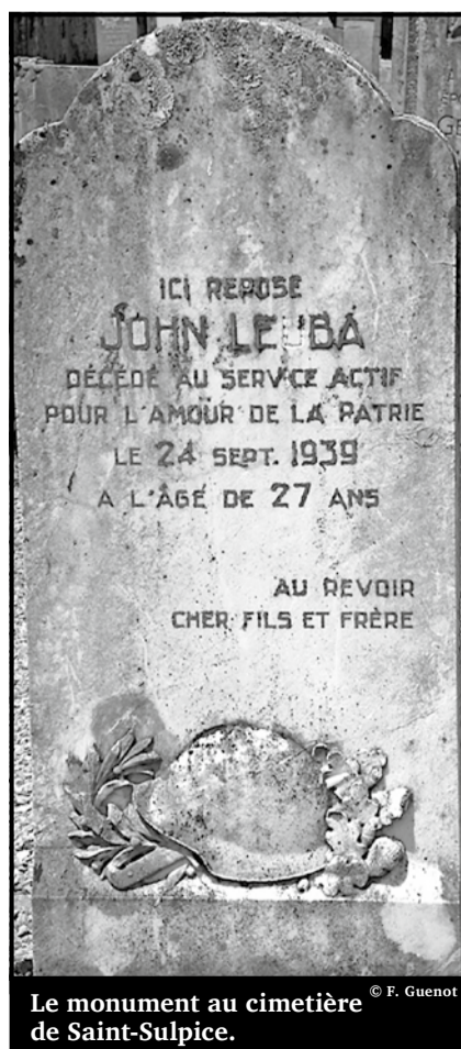
Le monument au cimetière de Saint-Sulpice. © F. Guenot

La photo de G. Burnier de Môtiers, montre la sortie de cercueil au Quartier du Pillial.