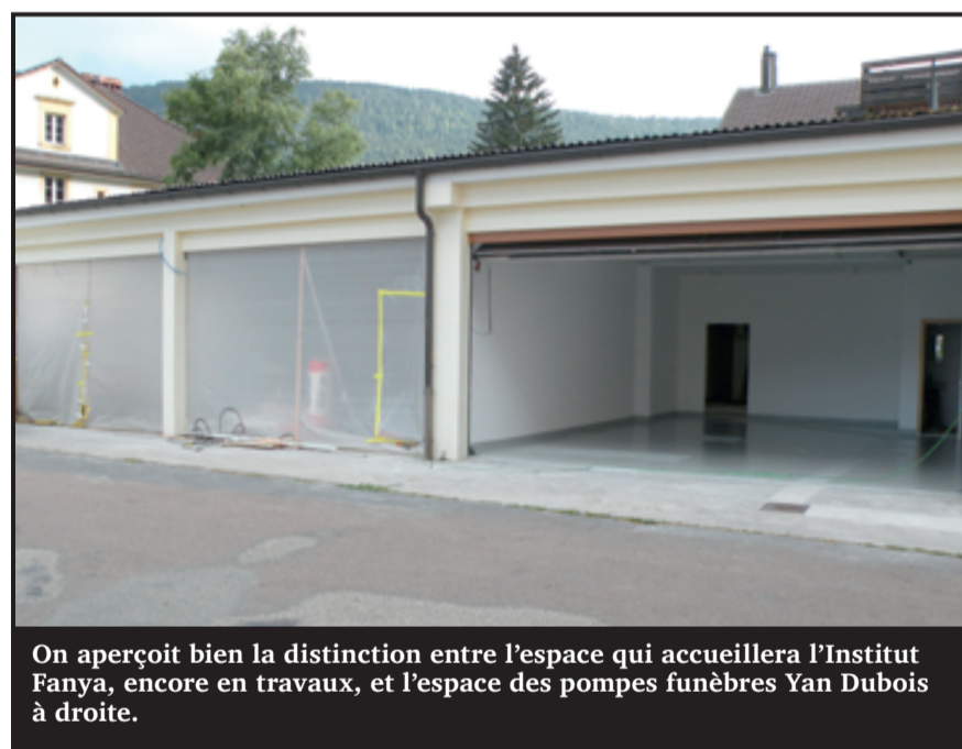
On aperçoit bien la distinction entre l'espace qui accueillera l'Institut Fanya, encore en travaux, et l'espace des pompes funèbres Yan Dubois à droite.

Sans parler d'autres facteurs plus terre à terre. « En fonction de l'heure, il n'y a parfois plus personne à l'accueil pour les guider. L'intimité y est aussi toute relative puisque la pièce réservée aux proches fait trois mètres sur deux. Et comme il n'y a pas de séparation, les trois défunts reposent les uns à côtés des autres, séparés par de simples rideaux. Les