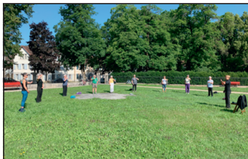
Christine Völlmin (tout à droite), lors de l'un de ses cours en extérieur cet été.

Cela permet d'apaiser certaines douleurs et de corriger la posture par exemple. « C'est une pratique douce et légère bien adaptée pour les personnes âgées. Mais elle est utile à tous ceux qui recherchent un équilibre ou plutôt