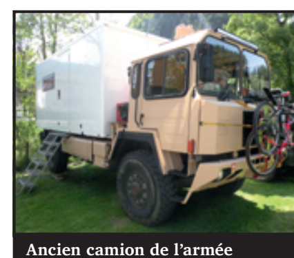
Ancien camion de l'armée

Bien que ce véhicule unique respire la liberté, il faut néanmoins respecter certaines normes pour qu'il soit homologué par le SCAN. « Ces démarches sont assez conséquentes et coûteuses. Ça revient presque moins cher d'acheter un modèle sur catalogue mais le plaisir n'est pas le même. » Avec toutes les améliorations du couple, l'assurance estime la valeur du « mobil-home militaire » à 389'000 francs. Et pour l'anecdote, le jeune homme n'a pas exécuté son service militaire mais il a été affecté au service civil.