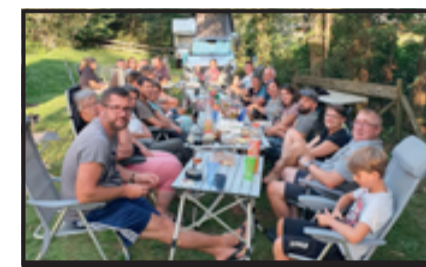
L'esprit camping-cariste résumé en une seule photo !