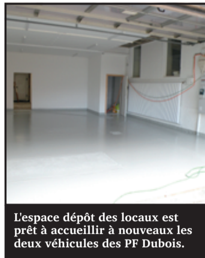
L'espace dépôt des locaux est prêt à accueillir à nouveaux les deux véhicules des PF Dubois.

« Cela avait un coût et la commune en est venu à se demander si ce n'était pas aux pompes funèbres de privatiser ce mini-centre funéraire.