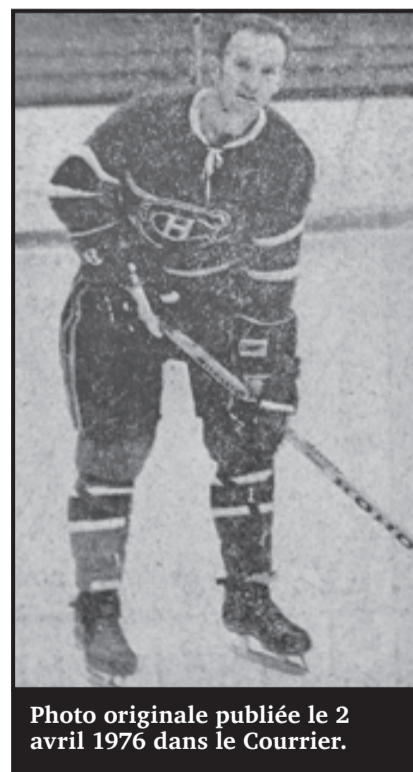
Photo originale publiée le 2 avril 1976 dans le Courrier.

Son nom, il l'a malgré tout ancré à tout jamais dans la glace helvétique. Lui qui a décroché deux titres de LNA en trois saisons disputées avec Villars. Lui qui a enchaîné avec six nouveaux sacres lors des dix championnats durant lesquels il a porté le maillot de La Chaux-de-Fonds entre 1966 et 1976. C'est après cette période dorée qu'il a occupé le poste d'entraîneur-joueur au CP Fleurier durant l'exercice 1976/1977. À 43 ans, il entamait sa reconversion vers la fonction de coach mais n'était pas encore prêt à poser l'équipement au placard.