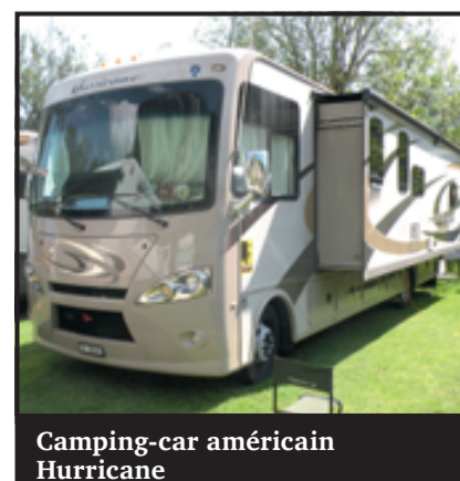
Camping-car américain Hurricane

Certaines chaînes de télévision comme Eurosport utilisent ce genre de modèles pour installer des régies mobiles lors de compétitions sportives. Des équipes cyclistes se servent aussi de ces « grands salons mobiles » comme salle de conférences sur de longues épreuves comme le Tour de France. Dimensions de ce modulable : onze mètres pour douze tonnes. Permis poids lourd obligatoire pour le manœuvrer. Certains campings refusent d'accueillir les modèles américains car ils risqueraient d'affaïsser le terrain.