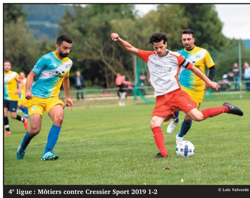
4 e ligue : Môtiers contre Cressier Sport 2019 1-2

Juniors FF15 : Val-de-Travers – Val-de-Ruz 8-0 ; après 3 matches, les filles du Vallon occupent la 1 er place sur quatre avec 9 points.