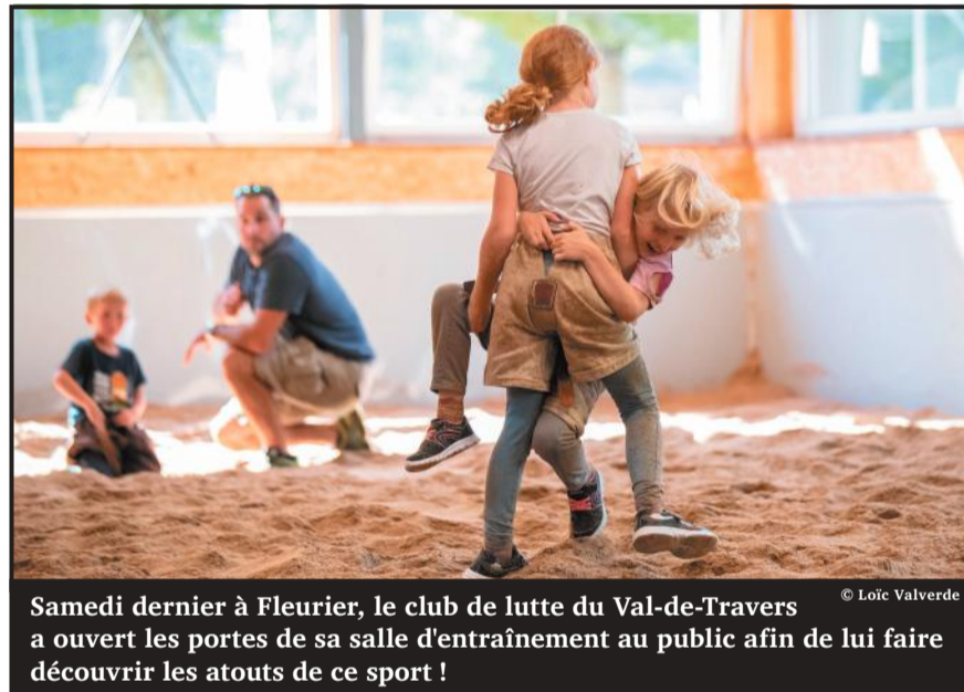
Samedi dernier à Fleurier, le club de lutte du Val-de-Travers a ouvert les portes de sa salle d'entraînement au public afin de lui faire découvrir les atouts de ce sport !