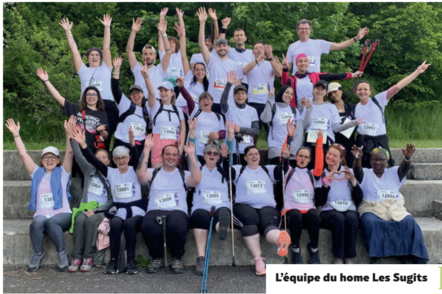
L'équipe du home Les Sugits

Prochaine et dernière étape de cette édition 2026, mercredi prochain à Neuchâtel.