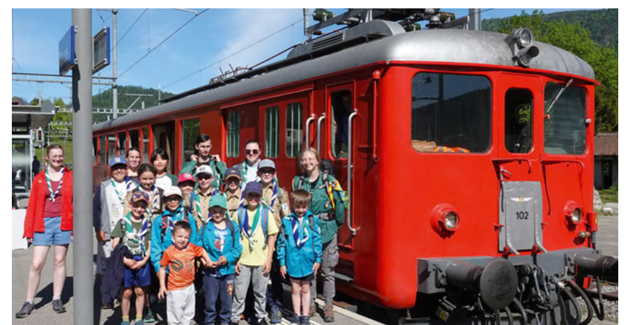
Samedi dernier, à la suite des retards dans le bas du canton, les scouts de Fleurier, de retour d'une journée de rencontres à Neuchâtel, ont utilisé « l'Étincelante » entre Travers et Fleurier

Un bar est à disposition dans nos trains pour permettre à nos clients de se ravitailler tout au long du voyage, avec des vins de la région, de la bière, de l'absinthe et des boissons sans alcool. Les cafés et les croissants sont offerts à l'aller. Les enfants et les membres de RVT-Historique bénéficient de réductions.