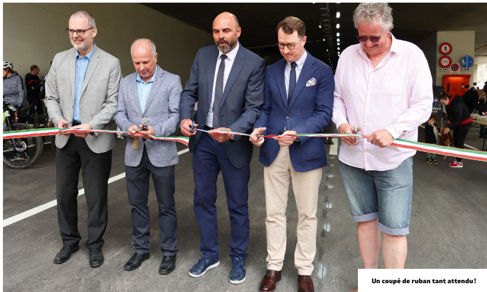
Un coupé de ruban tant attendu!

PAGES 10 & 11 Bon d'accord, on y va peut-être un peu fort en parlant de Vallon libéré. Mais il y avait un peu de ça, dimanche, pour la réouverture du tunnel après 4 ans de travaux. Dans le nombreux public venu fêter ce moment, on a senti de la fierté, un peu de soulagement et une liesse communicative.