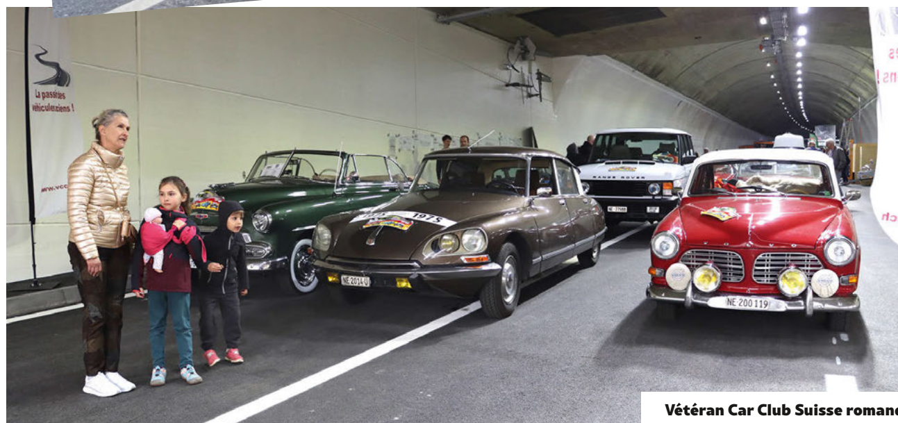
Vétéran Car Club Suisse romand