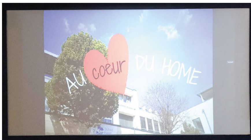
L'équipe d'animation du Home Dubied-Piaget lors de la projection