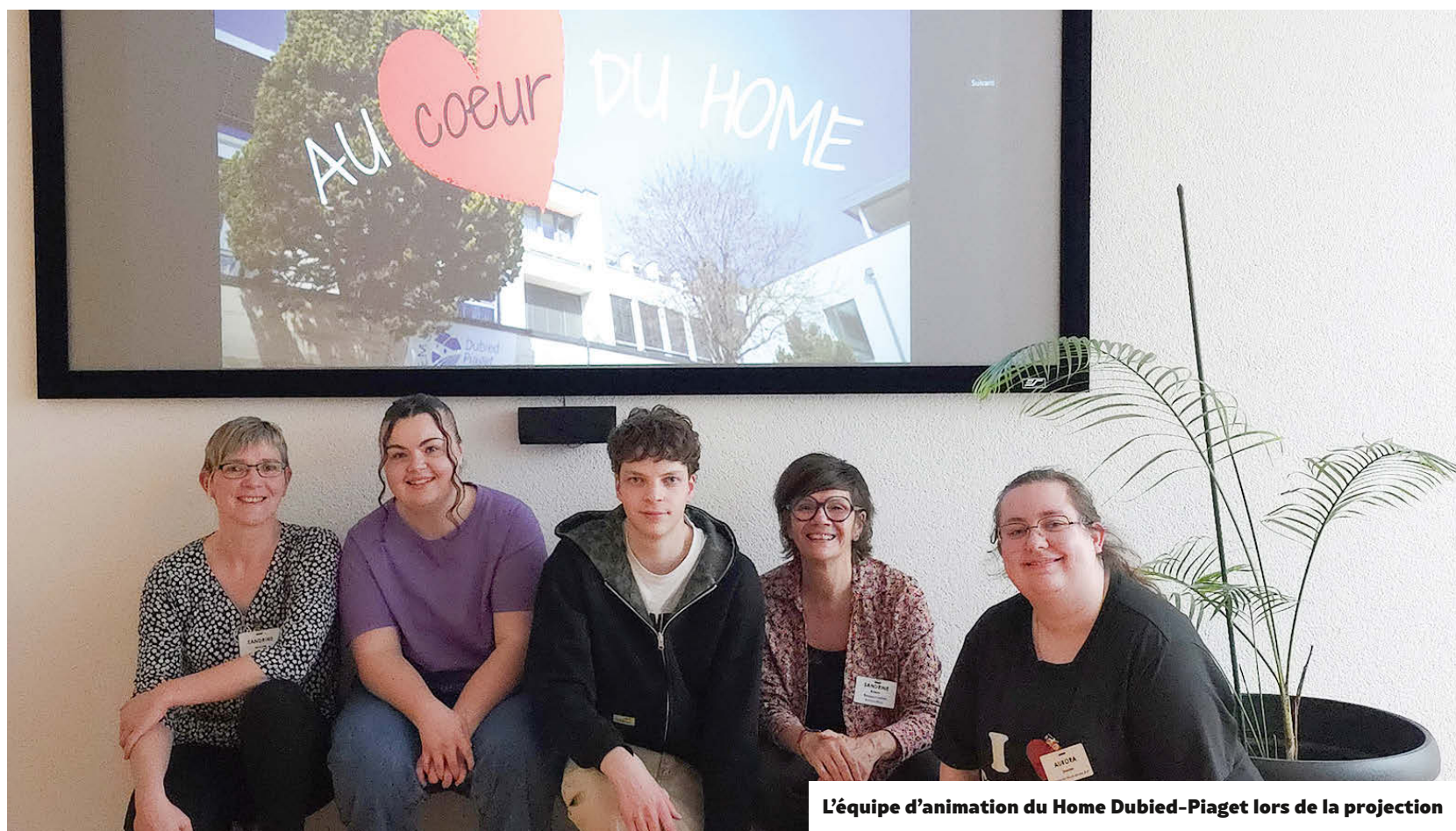
L'équipe d'animation du Home Dubied-Piaget lors de la projection

PAGE 3 Jeudi dernier, les résidents du Home Dubied-Piaget à Couvet et leurs proches ont pu voir le film « Au cœur du home », réalisé par deux apprentis de troisième année, dans le cadre de leur formation. Le Courrier du Val-de-Travers hebdo a rencontré les deux réalisateurs en herbe.