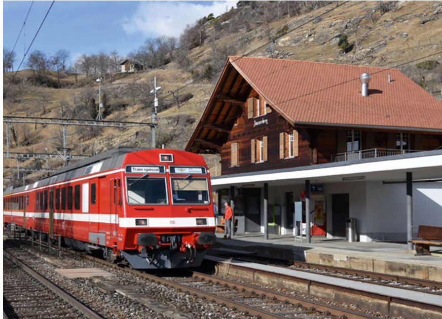
Le train spécial du RVT-Historique à destination de Brigue du 7 février 2026 en gare d'Ausserberg, sur la rampe sud de la ligne du Lötschberg.

Pour le RVT-Historique, la saison 2026 a déjà commencé le 7 février dernier avec un premier train spécial public à destination de Brigue, dans le Haut-Valais, par la ligne de faite du Lötschberg.