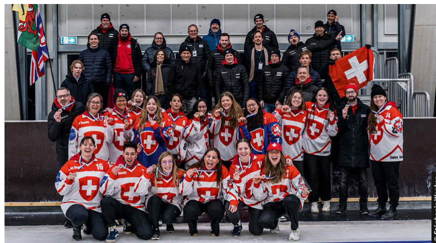
L'équipe féminine fêtant sa médaille devant la cohorte de supporters composée essentiellement de l'équipe masculine.