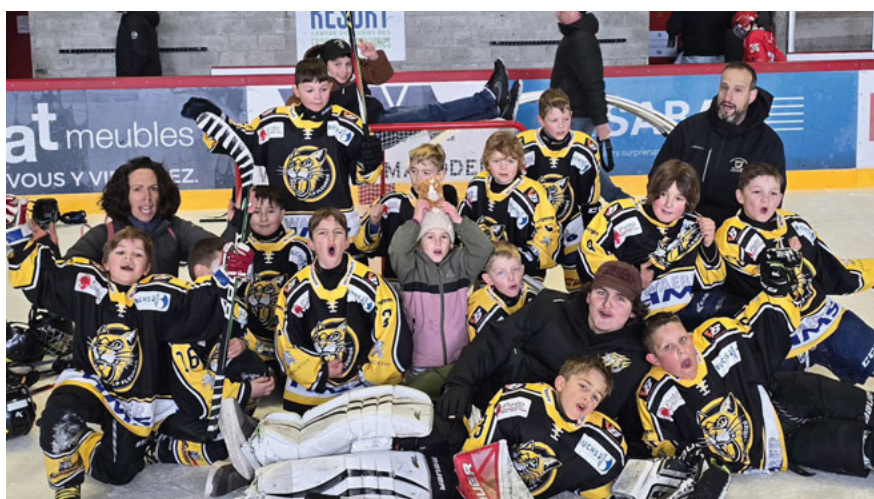
U9: 3 victoires, 1 match nul et 1 défaite au tournoi de Franches-Montagnes. Contre Saint-Imier 6-1, contre Moutier blanc 8-6, contre Ajoie 4-1, contre Franches-Montagnes 3-3 et 1-10 contre Delémont