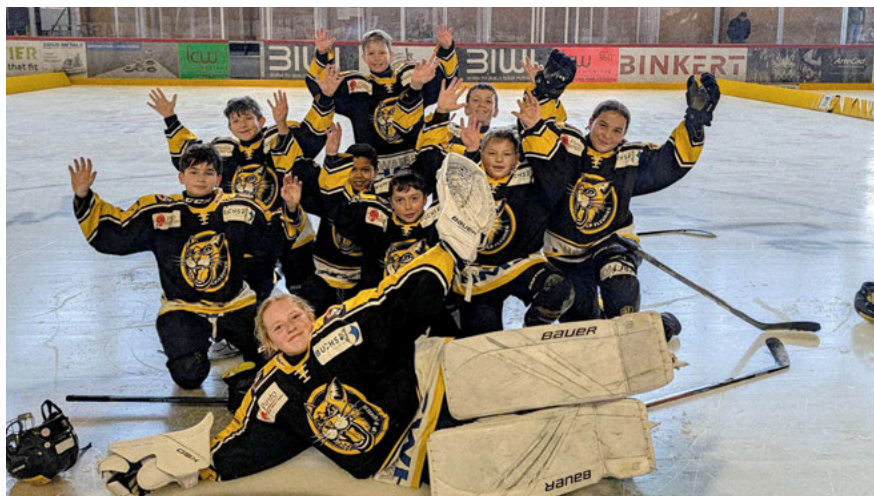
U12-1: 2 victoires et 1 match nul au tournoi de Saignelégier. Contre Franches-Montagnes 5-3, contre Delémont 7-3 et 5-5 contre HCC