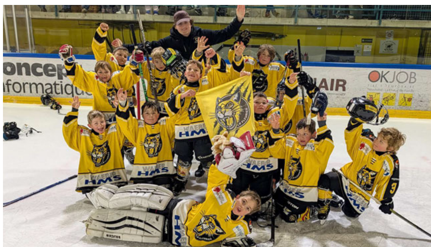
U9: 2 victoires, 1 match nul et 2 défaites au tournoi de Fleurier. Contre Moutier bleu 5-1, contre Tramelan 4-2, contre Franches-Montagnes 2-2, contre Saint-Imier noir 1-6 et 3-4 contre Moutier blanc.