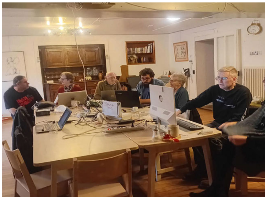
L'équipe du GULL VdT

Elle retourna alors au salon, enchantée et riche de cette expérience où ses yeux virent un groupe où la curiosité et l'entraide se conjuguent afin de rendre le numérique plus sûr et accessible à tous.